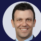
matthew kindree pallett valo llp